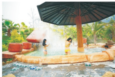
连城天一温泉度假村