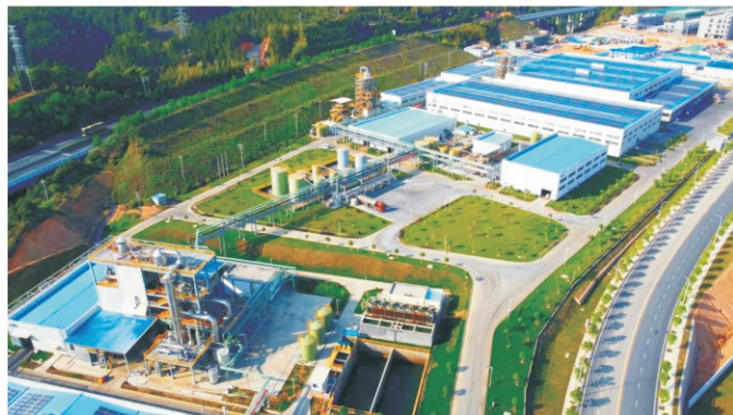
福建常青新能源科技有限公司