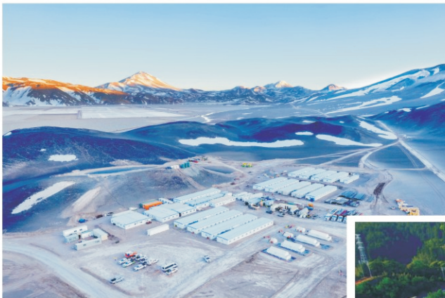
紫金矿业3Q盐湖锂矿

紫金矿业收购新锂公司进而拥有3Q盐湖锂，其体量在全球和品位都位居世界前列。拥有钴、锰、铜等矿产资源和正负极、电解液等关键材料，目前已落地常青新能源、时代思康等近30家大型企业。初步形成以电力电池梯级利用、锂离子电池材料配套为主的储能产业链，和以电线电缆、中低压设备和电池储能集成配套等企业为主的新罗区能源互联网产业集聚区。