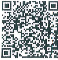
投洽会组委会证件系统

(二) 核酸检测点：组委会在会展酒店、会议中心酒店、瑞颐酒店、海悦山庄酒店、厦门宾馆等设置了十几个临时核酸检测点，有需要的人员可凭身份证免费就近检测（酒店清单详见附件）。