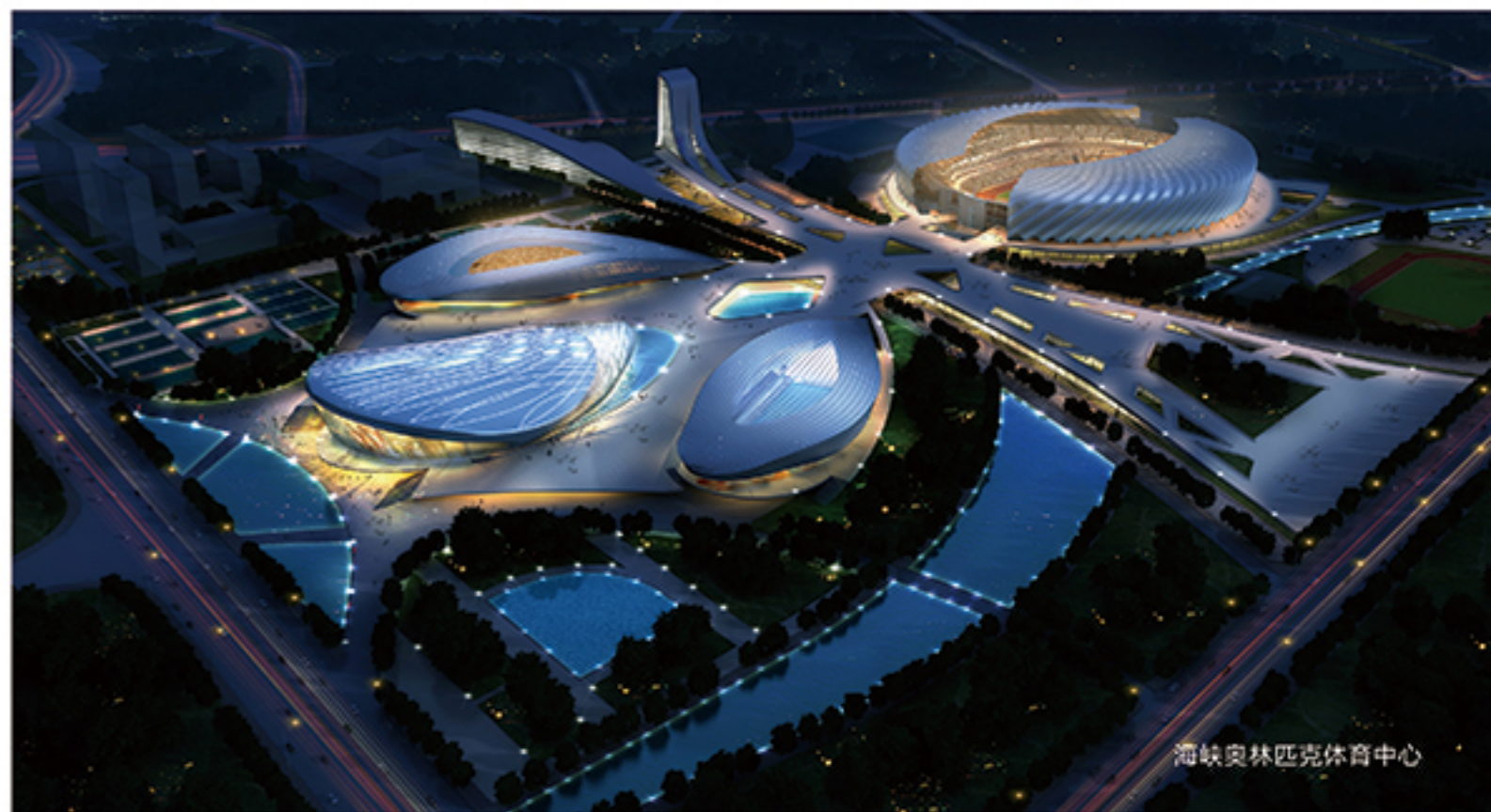
海峡奥林匹克体育中心