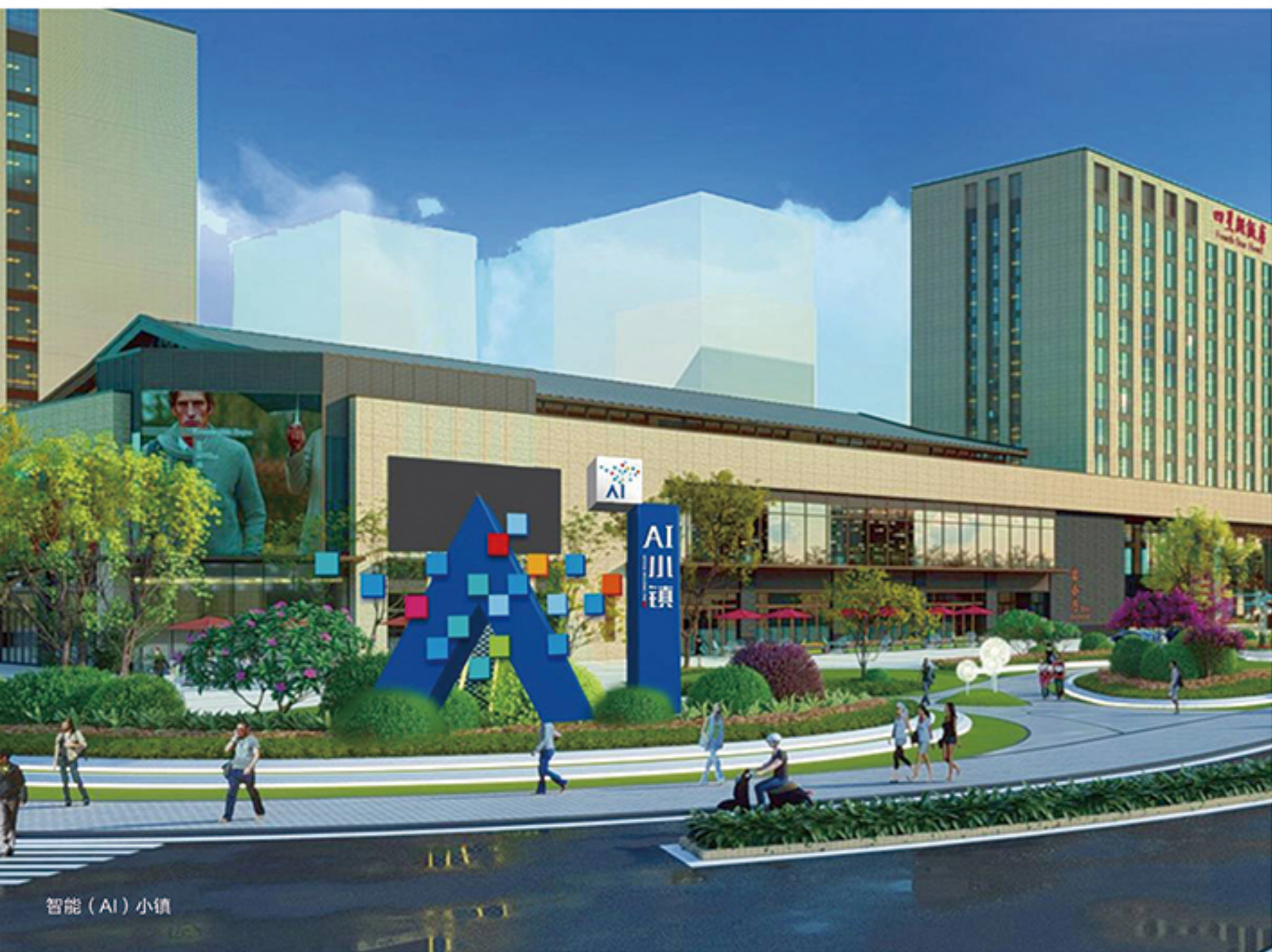
智能 (AI) 小镇