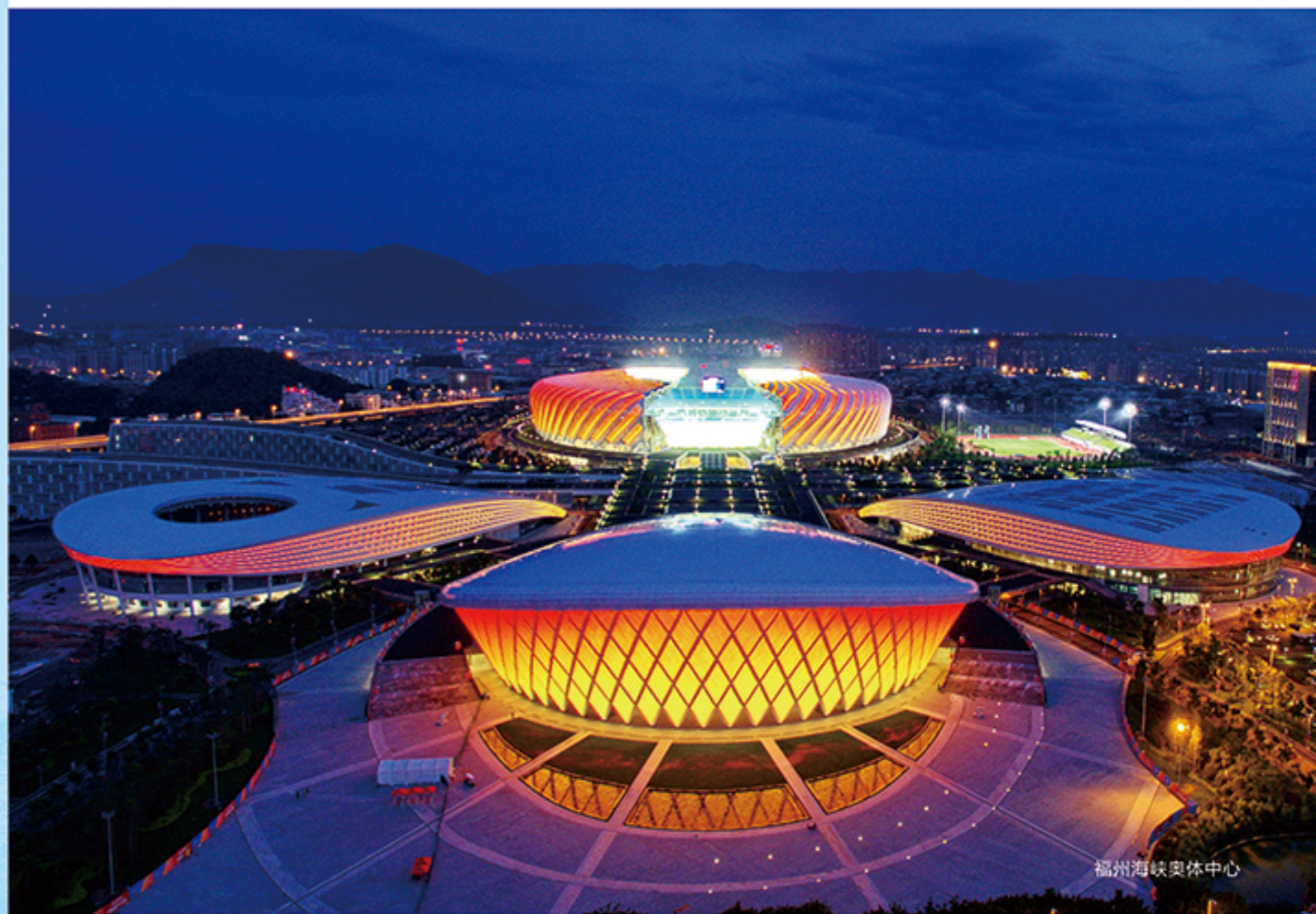
福州海峡奥体中心

仓山古称藤山，历史上曾以“十里花为市，千家梅作林”的繁华，赢得“琼花玉岛”的美誉。辖整个南台岛，面积142平方公里，下设5镇8街，总人口约104万。拥有国家级新区、海丝核心区、生态文明试验区、自贸试验区、自主创新示范区、海洋经济发展示范区等“六区叠加”政策优势。曾获全国绿色发展百强区、全国科技创新百强区、中国最具投资潜力中小城市百强区、全国科技进步先进区、全国文化工作先进区、全国首批智慧城市试点区、全国绿化“百佳县区”、国家知识产权强县工程试点区、省级文明城区、省级生态区、全市绩效“七连优”等荣誉。