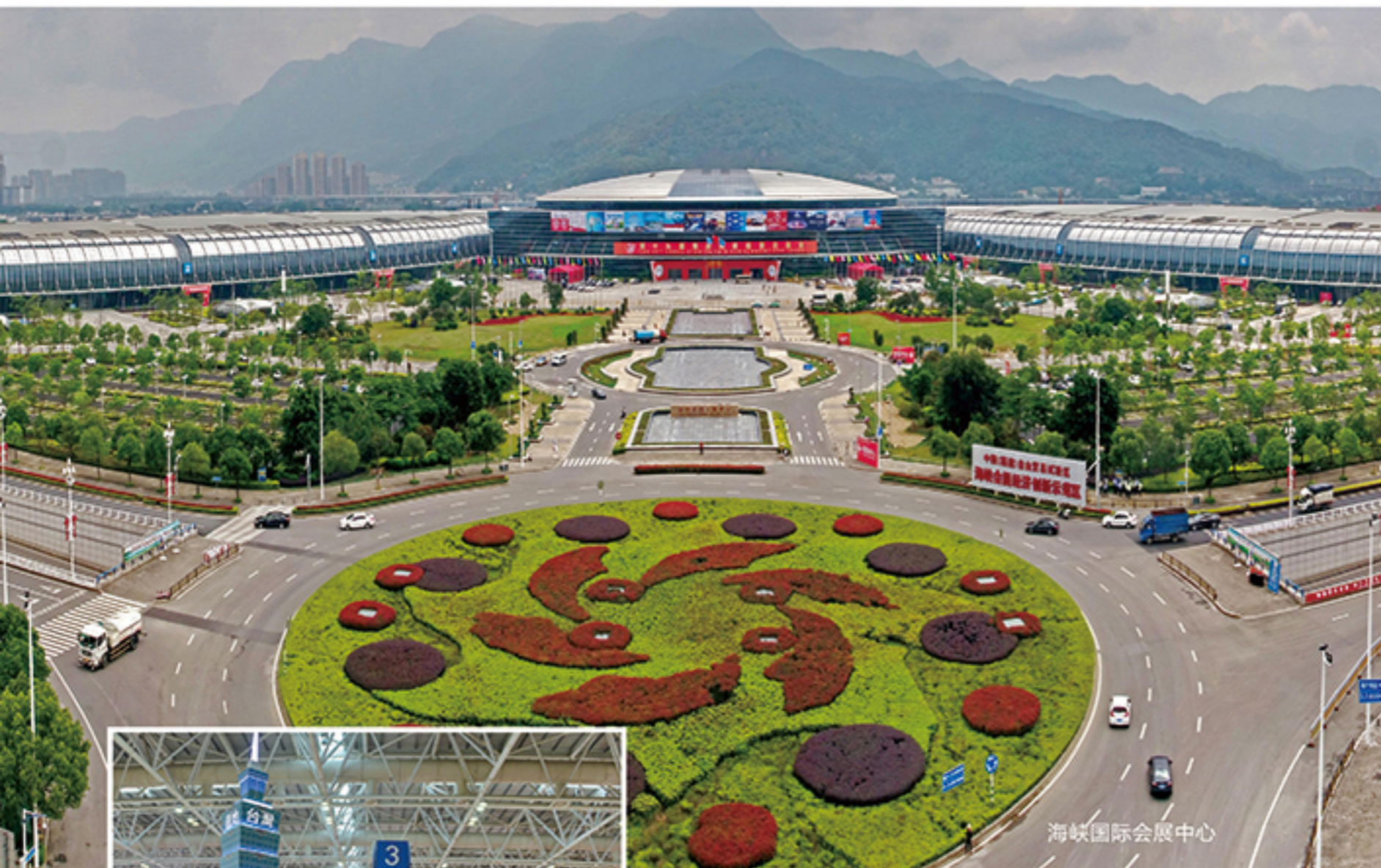
海峡国际会展中心