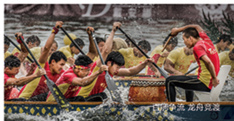
白塔争流 龙舟竞渡