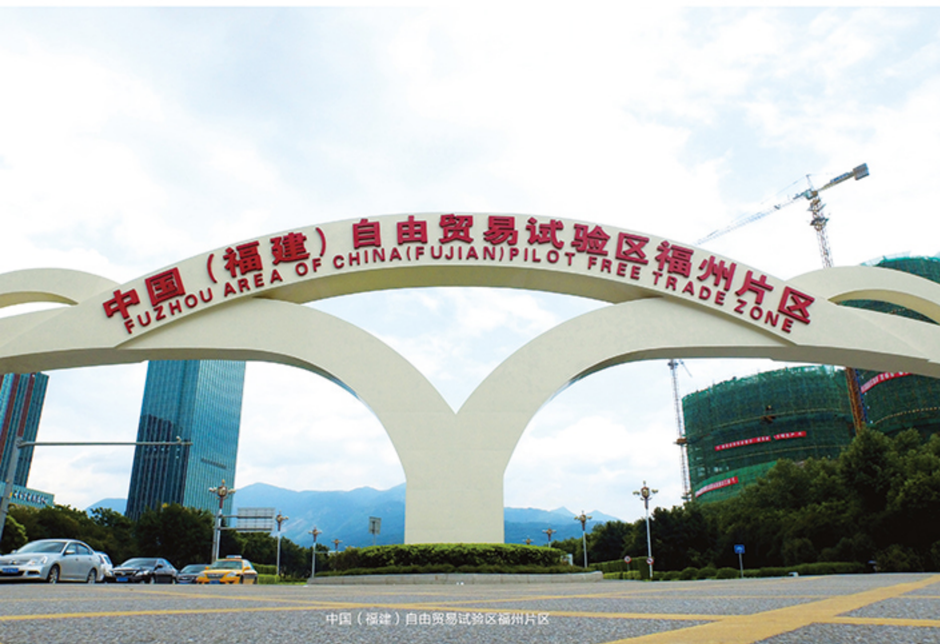
中国(福建)自由贸易试验区福州片区

中国(福建)自由贸易试验区福州片区南台岛区块规划面积5平方公里,毗邻闽江,环境优美,交通便利,大力发展总部经济、会展商贸、科技创新、跨境贸易和现代金融等重点产业,秉持建设改革创新新高地和对外开放先行区的初心,全力打造法制化、便利化、国际化的优质营商环境,为仓山经济发展注入全新活力。