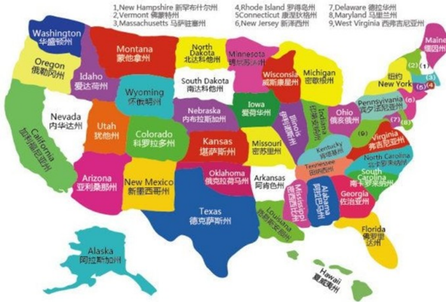
图 1 美国地理概貌

美国共分 50 个州和 1 个特区（哥伦比亚特区，首都华盛顿所在地），5 个自治领地。5 个自治领地里，联邦领地包括波多黎各和北马里亚纳；海外领地包括关岛、美属萨摩亚、美属维尔京群岛等。