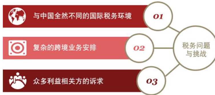
图5 海外工程项目税务特点示意图

海外工程项目也是“走出去”的常见形态之一。海外工程项目有别于国内工程项目存在如下三个主要的税务特征：