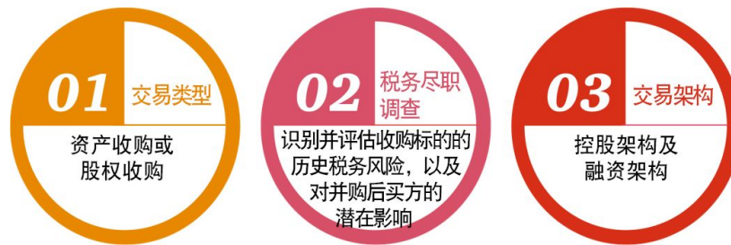
图4 海外并购税务要点示意图

按照常见的海外并购流程，并购前中国企业应该主要关注如下三项税务工作要点，并做好准备：